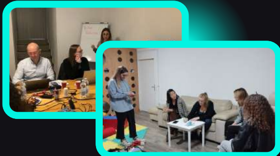
"Setting up the recruitment process" di EXEO Lab

Durante gli incontri di formazione dei trainers si sono svolti i seguenti workshop in modo interattivo e accattivante: