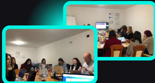
"Zdravje in blagostanje na delu" ISSBS .