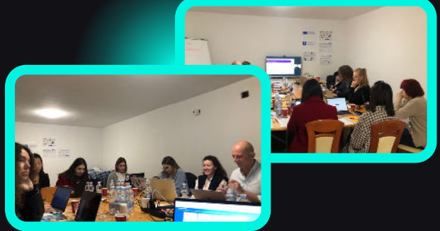
"Salud y bienestar en el lugar de trabajo" por el ISSBS .